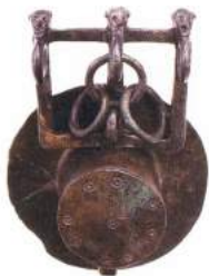
Het beroemde wagengraf, dat in 1895 op de Wezelse Berg is gevonden.

In Wuzeke is in 1247 door de kloosterorde van de Cisterciëncers een stiftshoeve gebouwd. In 1296 hebben de Ridders van St. Jan in Woezik een hof bezeten, waarvan de opbrengst diende ter ondersteuning van de zieken in Nijmegen in het Gasthuis van de Johanniters; Johanniter Orde is een ridderlijke orde met een protestants-christelijke grondslag en in 1099 gesticht.