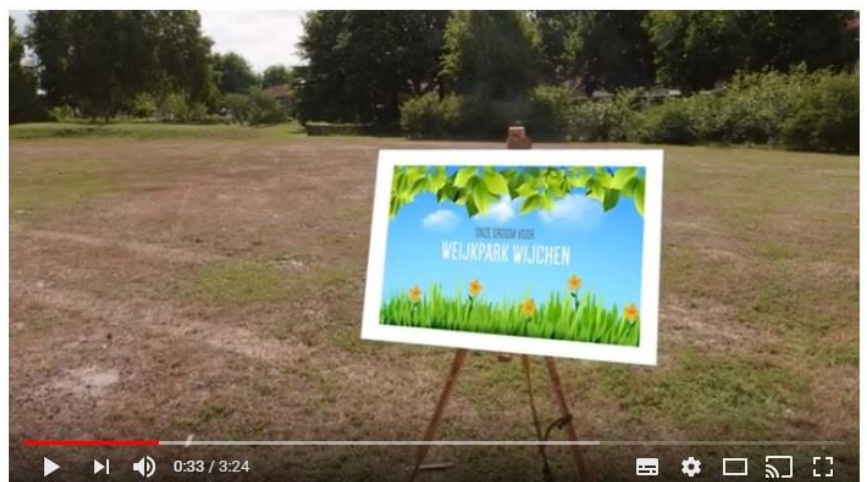
Inspiratiefilm Weijpark Wijchen | Leefbaarheidsalliantie