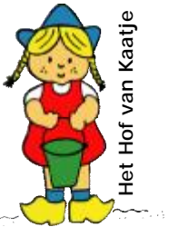
Het Hof van Kaatje

De zeventiger jaren waren een tijd van veel veranderingen, ook in de Woezik. De kerk werd minder belangrijk in het maatschappelijk leven. Er kwam rond 1970 een forse uitbreiding met de bouw van Veenhof. Ook de Paschalisschool verhuisde naar nieuwbouw in de Veenhof.